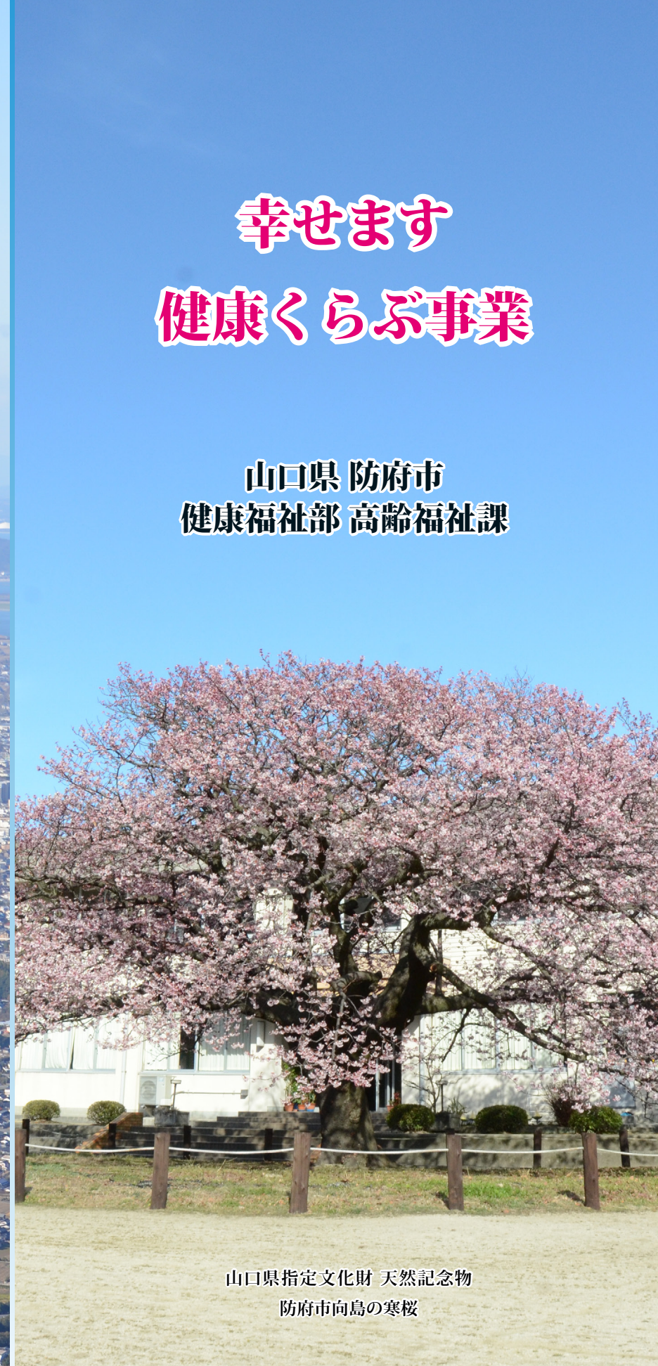
山口県指定文化財 天然記念物 防府市向島の寒桜